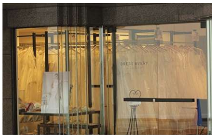
①DRESS EVERY AOYAMA