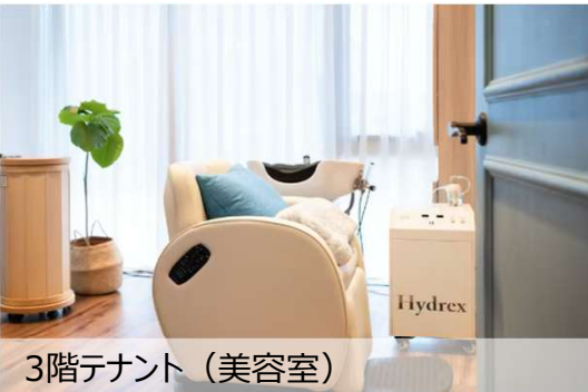
3階テナント (美容室)