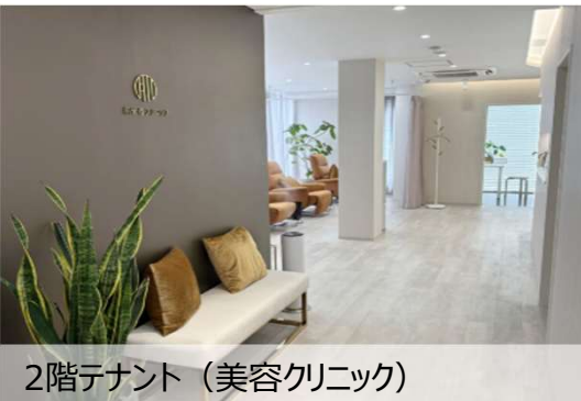
2階テナント (美容クリニック)